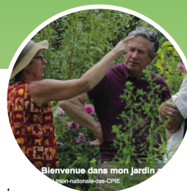
Bienvenue dans mon jardin Union-nationale-des-CPIE

Cette opération d'envergure nationale est proposée par le réseau des centres permanents d'initiatives pour l'environnement . Acteurs citoyens et professionnels de l'environnement et de la sensibilisation, ils accompagneront les jardiniers amateurs volontaires pour les aider à accueillir le public, promouvoir leurs pratiques et faire de ce week-end un temps de partage privilégié.