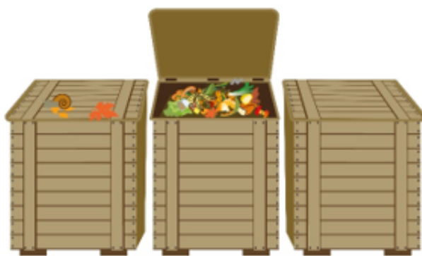
En pied d'immeuble ou en établissement