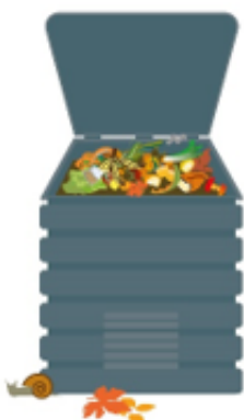
En maison avec jardin

À partir de décembre 2023, tous les habitants devront bénéficier d'une solution de tri à la source des déchets alimentaires. Aussi, l'Agglo propose une solution adaptée à chacun avec la mise à disposition gratuite de composteurs individuels, lombricomposteurs et composteurs partagés.